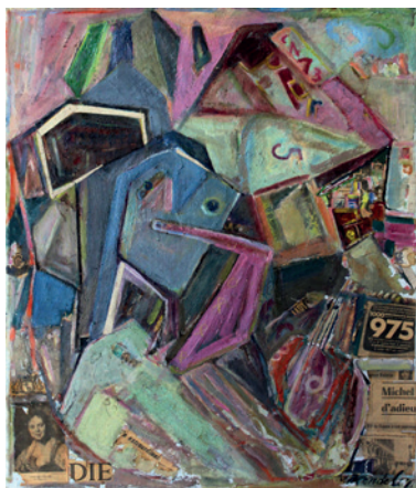
Der Astronaut und der Gondoliere Öl auf Leinwand, 1958

Anschließend kleiner Steh-Empfang. Po uvítání bude nabídnuto menší občerstvení.